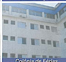
Colônia de Férias