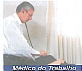
Médico do Trabalho

Este serviço é gratuito em nosso Sindicato. Informamos, ainda, que todas as homologações são feitas com hora marcada.